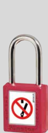
S31-NS / 410-NS

Le verrouillage permet d'interrompre et de bloquer les sources d'énergie lors de la réparation ou l'entretien de la machine ou de l'installation. Les cadenas sont disponibles en nombreuses versions de fermeture. (clés différentes, même clés, avec clé principale)