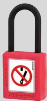
S32-NS / 406-NS