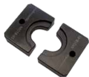
CHF (exkl. MWST / excl. TVA) freibleibend / sans engagement